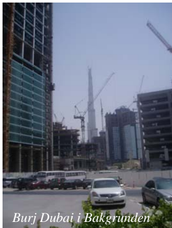
Burj Dubai i Bakgrunden